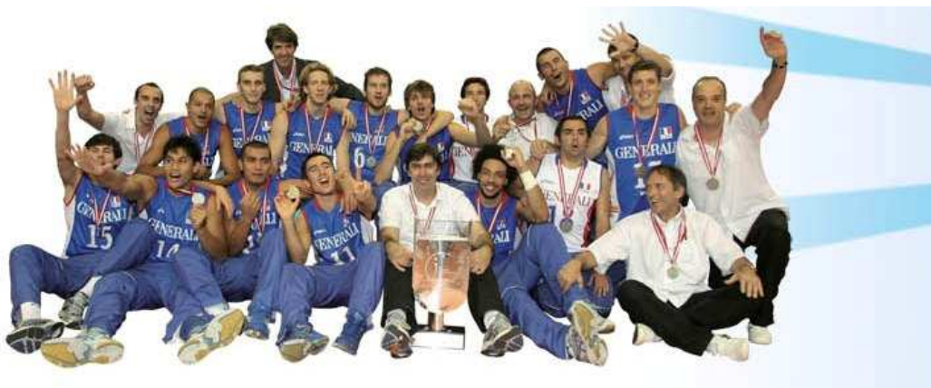
L'équipe de France vice-championne d'Europe 2009

Contact presse FFVB : Hubert Guériaux – 06 09 76 43 99