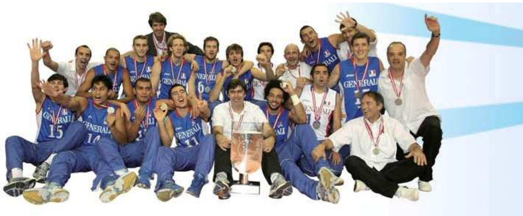
L'équipe de France vice-championne d'Europe 2009

Contact presse FFVB : Hubert Guériaux – 06 09 76 43 99