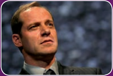
Christian Prudhomme est né le 11 novembre 1960.

Journaliste diplômé de l'École supérieure de journalisme de Lille (59e promotion), il est le directeur du Tour de France. Il occupe cette fonction depuis 2005, après avoir été l'adjoint de Jean-Marie Leblanc pendant 2 ans. Avant de rejoindre l'équipe dirigeante du Tour de France, il était journaliste sportif sur France Télévisions. Il a notamment commenté plusieurs éditions du Tour et a animé l'émission Stade 2. Il a participé à la création de L'Équipe TV en 1998 en tant que rédacteur en chef. Il a également été journaliste sportif à Europe 1, à La Cinq et à LCI.