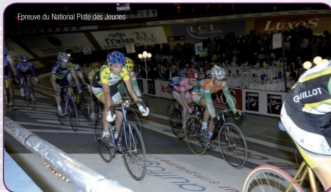
Epreuve du National Piste des Jeunes